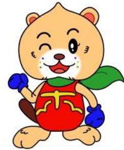
保原小マスコット キャラクター 「ほばラッキー」