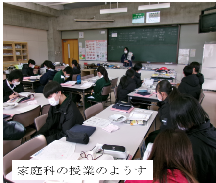
家庭科の授業の様子