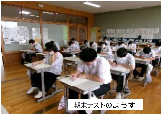
期末テストのようす

一学期終業式は七月十九日（金）です。夏休みまであと三週間となりました。生徒のみなさんには、まもなく「夏休みの計画」を立ててもらうこととなります。そこで、三年生のみなさんに夏休みの生活で気を付けたいことについて聞いてみました。 圧倒的に多かったのは、「勉強（受験勉強）をする。」という回答でした。（毎日五時間以上勉強したいと考えている生徒もいます） また、部活動引退後の夏休みであるため、部活動のない生活への