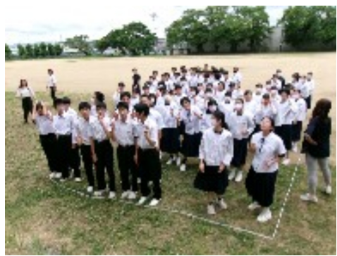
卒業アルバム写真撮影

次回の二学期中間テストでは、今回の反省を反映した学習計画になることを願っています。