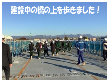
建設中の橋の上を歩きました!

今までしたことのない体験をすることができました。特に高所作業車体験が新鮮でとても面白かったです。今回学んだことを将来の職業選別に役立てていきたいです。