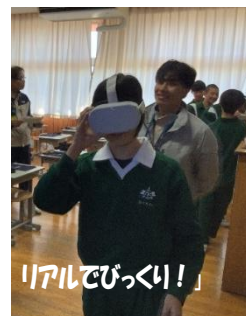
リアルでびっくり!