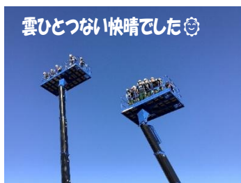
雲ひとつない快晴でした☺