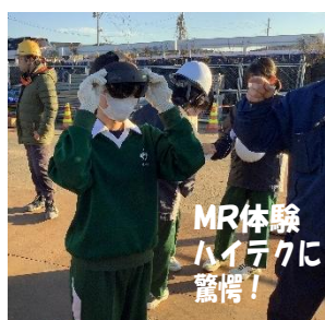
MR体験 ハイテクに 驚愕!