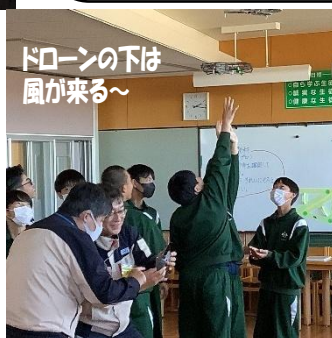
ドローンの下は 風が来る～