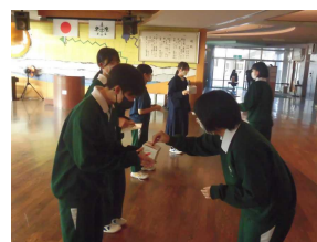
【登校時の募金活動】

11月28日(金)から12月5日(金)の期間、登校する時間帯に生徒会役員が1階多目的ホール前で赤い羽根共同募金運動を行いました。大きな声で募金を呼びかけ、多くの生徒が募金をしていました。さまざまな地域福祉の課題解決に取り組む民間団体を応援する、「誰もが安心して暮らせる地域社会」の実現に向けて実施されている共同募金です。地域社会の一員としての意識を高め、助け合い、補い合って生活することの大切さを身に付けてほしいと思います。