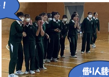
借り人競争 親友を探せ！