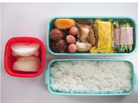
生徒のみなさんが作ったお弁当