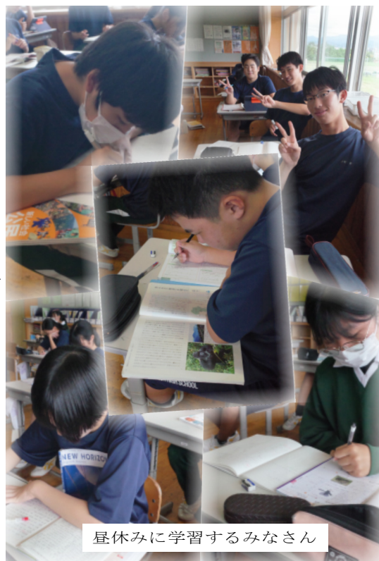
昼休みに学習するみなさん

九月二十六日(木)・二十七日(金)の二日間に渡って二学期中間テストが行われました。先週は実力テストが実施され、三年生のみなさんは二週連続のテストが終わりほっとしていることと思います。 学習計画表に実際に家庭学習を行った時間を記入しています。ある学級の家庭学習時間は、一日平均2時間40分、多い生徒は一日平均4時間20分、少ない生徒は1時間40分となっていました。(9月9日から16日間の集計結果) 前日、生徒のみなさんに