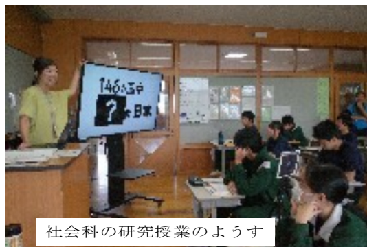
社会科の研究授業のようす

四回実力テスト、11月1日(金)には二学期期末テストが実施されます。まだ先のことを考えず、計画的に学習を進めてほしいと思います。