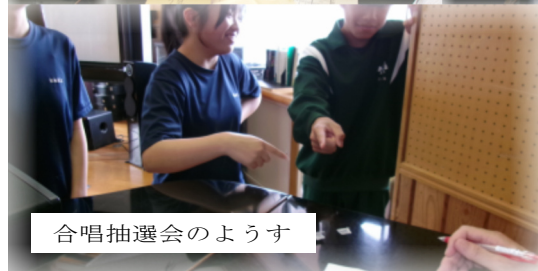
合唱抽選会のようす