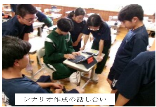
シナリオ作成の話し合い