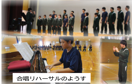
合唱リハーサルのようす