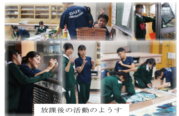
放課後の活動のようす

桃花祭は、実行委員のみなさんの活動と一人一人の生徒の熱意と努力によって成り立っています。うことをしみじみと感じています。