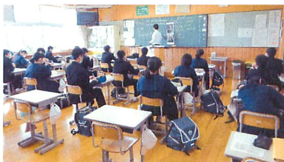
木曜日までは人数を減らして授業を行いました。

今後は, 本県の緊急事態宣言の解除を受けて, 段階的に様々なことが緩和されていくことになると思われますが, 新型コロナウイルス感染が完全に終息したわけではありません。予防については, 引き続き徹底していくこととなりますので, ご家庭でもご理解とご協力をよろしくお願い致します。