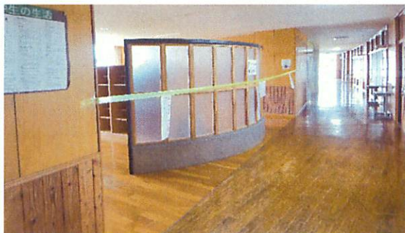
今週はロッカールームの使用は禁止です。