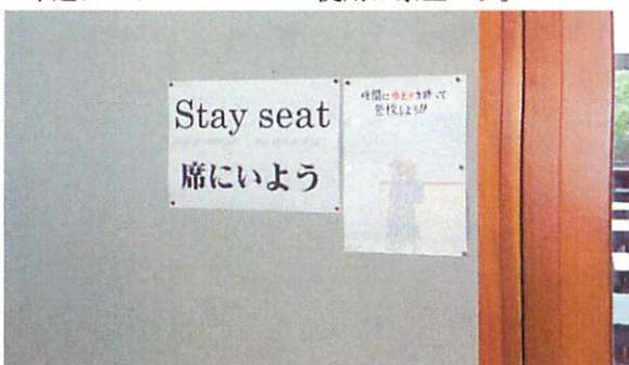
教室入口には, このような掲示物を貼りました。

<次週の予定> 授業は短縮45分で行います。清掃は行いますが, 部活動はありません。