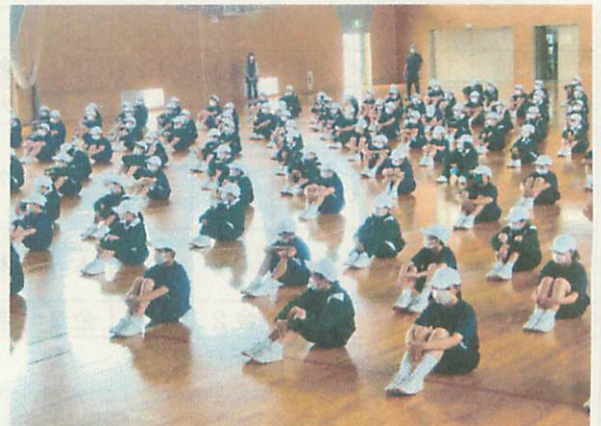
【避難後、校長先生の話真剣に聞く生徒】