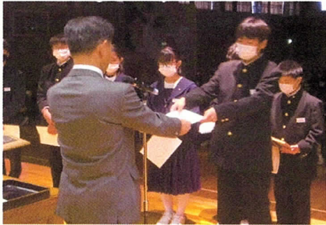
合唱コンクール 金賞1組

今週開いた学年集会では、この努力や協力など文化祭の準備や練習で、「何を学んだか」が大切であること、そして、学んだことを明日からの生活に活かしていくことを伝えました。