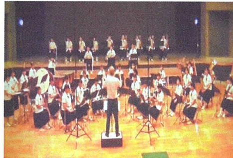
吹奏楽部演奏上映