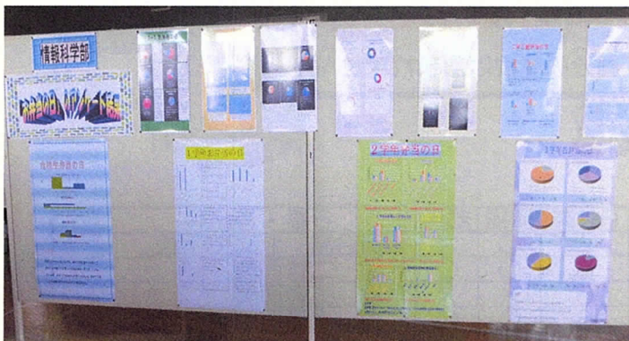
情報科学部 統計グラフ