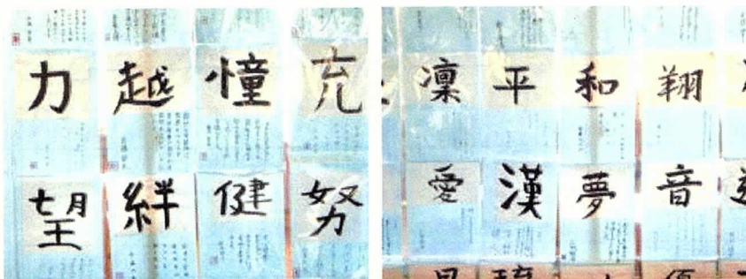
「国語科」の習字作品

現在、1階廊下には、桃花祭で展示した「習字」「英文の自己紹介」情報科学部作成の「お弁当の日アンケート統計ポスター」、そして、性教育講座でまとめた「私の小さい頃」も掲示しています。学校へ行こう週間に来校され、ぜひ、ご覧ください。