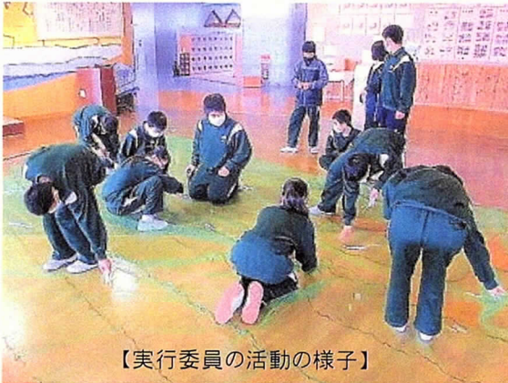
【実行委員の活動の様子】

来週30日(月)実施予定の学年レクに向けて、実行委員会16名が日々、企画・準備に頑張っています。今回の学年レクは、みんなが、みんな、楽しみ、笑顔になろうと、これまでにない内容になっています。