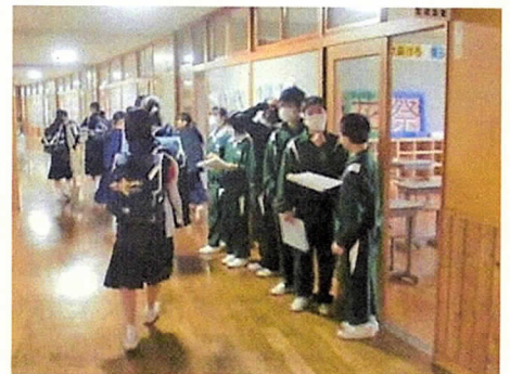
【あいさつ運動の様子】

後期学年運営委員会では、先月、学年の課題は何か？をテーマに話し合いを行いました。様々な課題が各学級から出されましたが、今、向上させなければならないのは、「あいさつ」で一致しました。 「あいさつをしない」「あいさつの声が小さい」「進んであいさつしない」 等々。生活の基本、コミュニケーションの基本を向上させたいという思いから、毎週木・金曜日にあいさつ運動を始めました。誰よりも早く登校し、今は寒い廊下で、元気よくあいさつをしています。朝も、昼も、帰りも…。友だち同士、先生方に、また来校されたお客様にも、 進んであいさつができる学年 になってほしいと思います。