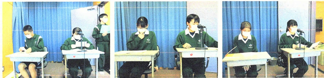
<専門委員会委員長からの活動計画報告>