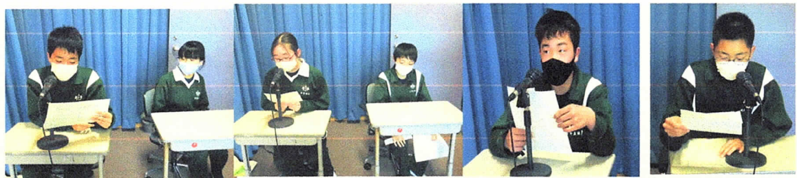
<部活動部長からの活動計画報告>