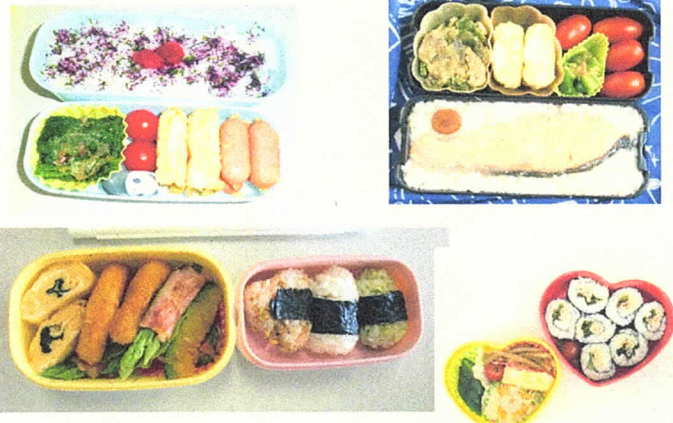
昨年の「弁当の日」のお弁当