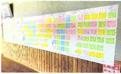
上の写真 多目的ホール前に掲示された 1・2年生からのメッセージ 右の写真：1年1組～3組のメッセージ