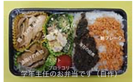
学年主任のお弁当です（自作）