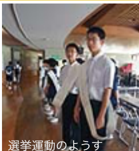
選挙運動のようす