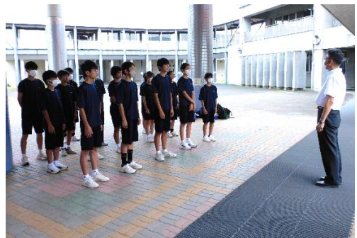
当日朝の出発式の様子

なお、駅伝の県大会は、10月4日（水）に今回と同じあづま運動公園内周辺コースで行われます。女子チームの皆さんは、さらに走りに磨きをかけて、好成績を収めることを期待しています。