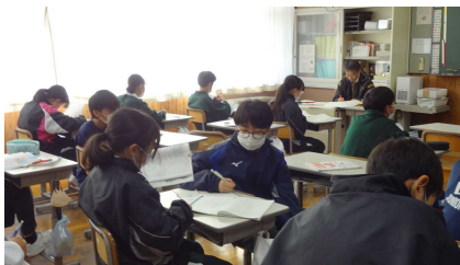
テスト当日の朝の様子

今日から12月です。期末テストが終わり、答案も返却がほぼ終わりました。来週には成績票を配付する予定です。提出物もしめきりを迎えています。教科の課題はテストと同様に大切ですので、しっかり取り組んでほしいと思います。長かった2学期も終盤です。収穫の秋が終わり、力を蓄える冬です。春に向けて、じっくりと自分の力をつけていきましょう。